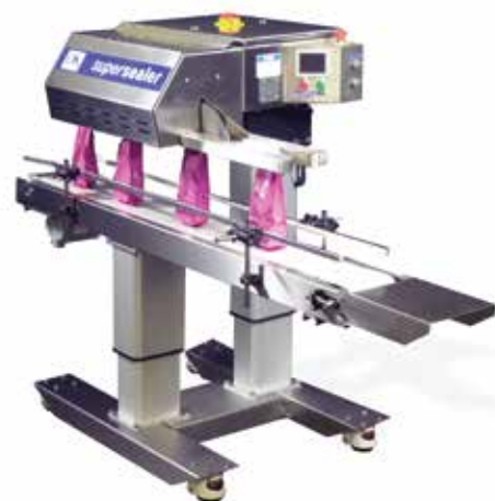
Roestvrijstalen Supersealer-basis met wieltjes & gemotoriseerd voetstuk en optionele BBY-100-transportband