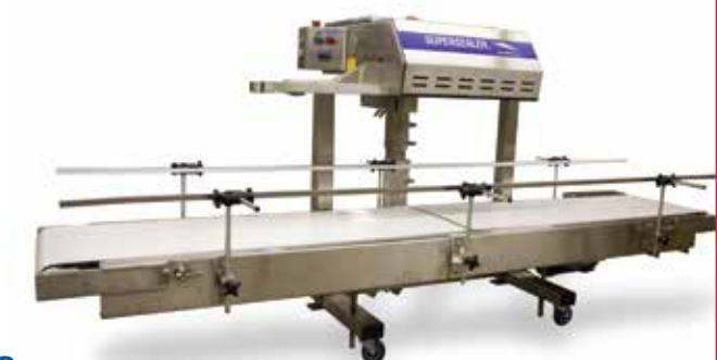
Roestvrijstalen Supersealer-basis met wieltjes & voetstuk met gasveer en optionele M-500-transportband.