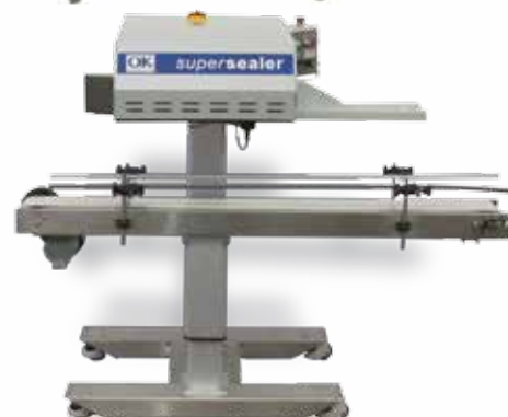
Geverfde Supersealer-basis met wieltjes & gemotoriseerd voetstuk en optionele BBY-100-transportband