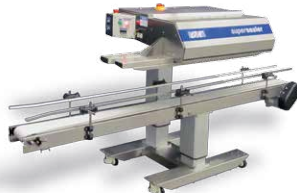
Roestvrijstalen Supersealer SB30-basis met wieltjes & elektrisch voetstuk en optionele BBY-200-transportband.