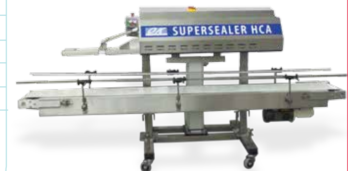
Roestvrijstalen Supersealer SS4-basis met wieltjes & elektrisch voetstuk en optionele M-500-transportband