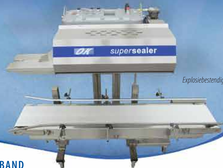
Explosiebestendige SB30 met optionele M-500-transportband