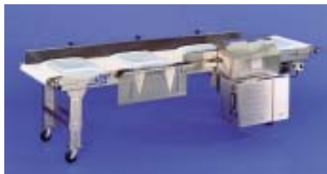
T-Pak 500 systeem voor horizontale zakdoorvoer. De T-Pak 500 drukt met een band de bovenkant van de zak eerst samen.