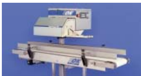
OK Supersealer met Model 100 transporteur voor verticale zakdoorvoer.